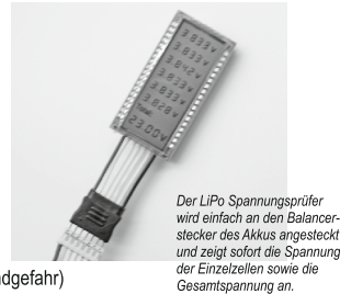
Der LiPo Spannungsprüfer wird einfach an den Balancerstecker des Akkus angesteckt und zeigt sofort die Spannung der Einzelzellen sowie die Gesamtspannung an.