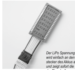
Der LiPo Spannungsprüfer wird einfach an den Balancerstecker des Akkus angesteckt und zeigt sofort die Spannung der Einzelzellen sowie die Gesamtspannung an.