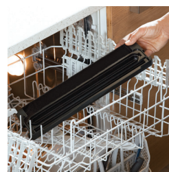
Vaschetta lavabile in lavastoviglie Tray washable in dishwasher