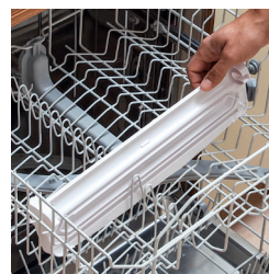
Vaschetta lavabile in lavastoviglie Tray washable in dishwasher