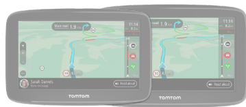
TomTom GO Classic

TomTom ist bekannt für seine Benutzerfreundlichkeit und bietet zahlreiche Funktionen, die entwickelt wurden, um Ihre Fahrt reibungslos und intuitiv zu gestalten. Dank der einzigartigen RouteBar, Weltkarten-Updates, TomTom Traffic und 12 Monaten Radarkamerawarnungen ist das Go Navigator ein umfassendes GPS-Navi für jedermann.