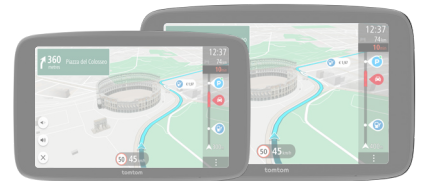
TomTom GO Superior