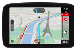
TomTom GO Navigator