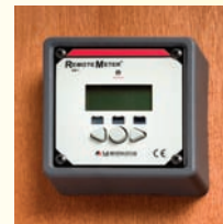
Befestigung mittels Halterung