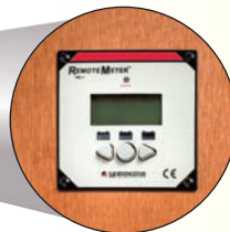
Befestigung in der Wand