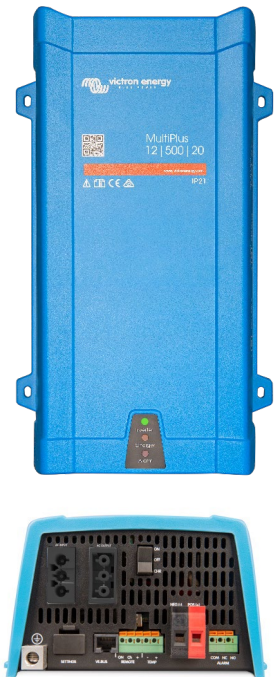
MultiPlus 500 / 800 / 1200 / 1600 VA