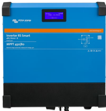
Wechselrichter RS Smart 48/6000