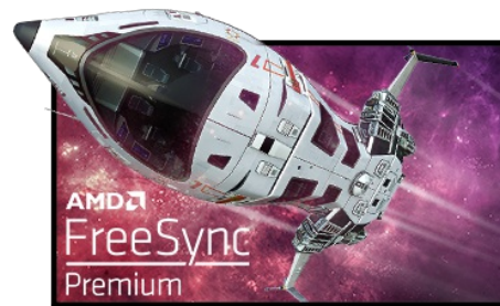
FreeSync™ Premium Technologie

Die Fast IPS Technologie garantiert nicht nur lebendige Schlachtfeldszenen mit hoher Farbtreue, sondern auch eine ultraschnelle Reaktionszeit von nur 0.8ms (MPRT) für bewegte Bilder.