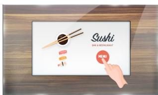
Touch durch Glas

Der ProLite T2234MSC-B1S ist ein 22" Multi-Touch-Monitor mit projektiv kapazitiver Touch-Technologie (10 kompatible Touch-Punkte) und Sicherheitsglas bis zum äußersten Rand. Ausgestattet mit einem auffallend schönen Design und einem IPS Panel mit Full HD (1920x1080) Auflösung, bietet das Gerät eine ausgezeichnete Farbwiedergabe bei großen Betrachtungswinkeln, was ihn zum perfekten interaktiven Display für Digital Signage Anwendungen macht. Analoge und digitale Eingänge bieten größtmögliche Flexibilität beim Anschluss, das Touch-Interface wird über einen USB-Steckplatz angesteuert. Dank der Touch-durch-Glas Technologie werden präzise Touch-Reaktionen auch durch eine separate Glasschicht ermöglicht. Eine IP65 Zertifizierung garantiert den Schutz vor Staub und Wasser, damit eignet sich der Monitor ganz besonders für interaktive Anwendungen.