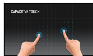
Touch Technologie - Kapazitiv

Dieses Touchscreen-Display mit Touch-durch-Glas-Funktion verwandelt herkömmliche Glasoberflächen in interaktive Touchscreens. Perfekt verwendbar für interaktive Schaufenster, POS oder in Restaurants als digitales Menü.