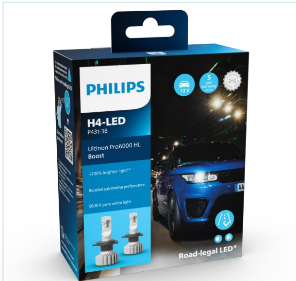
H4-LED Boost X2 Verpackung, Inhalt 2 Lampen