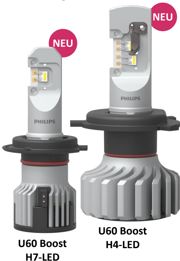
U60 Boost H7-LED

Machen Sie die Nacht zum Tag mit der leistungsstärkeren und kompakteren Philips Ultinon Pro6000 Boost LED. Wechseln Sie jetzt noch leichter die Halogenlampen Ihrer Scheinwerfer durch unsere geprüft sicheren und straßenzugelassenen 1 LED-Nachrüstlampen und erleben Sie bei bereits mehr als 450 Fahrzeugmodellen die bahnbrechende Helligkeit der neuen Philips Ultinon Pro6000 Boost.