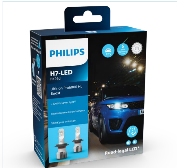
H7-LED Boost X2 Verpackung, Inhalt 2 Lampen