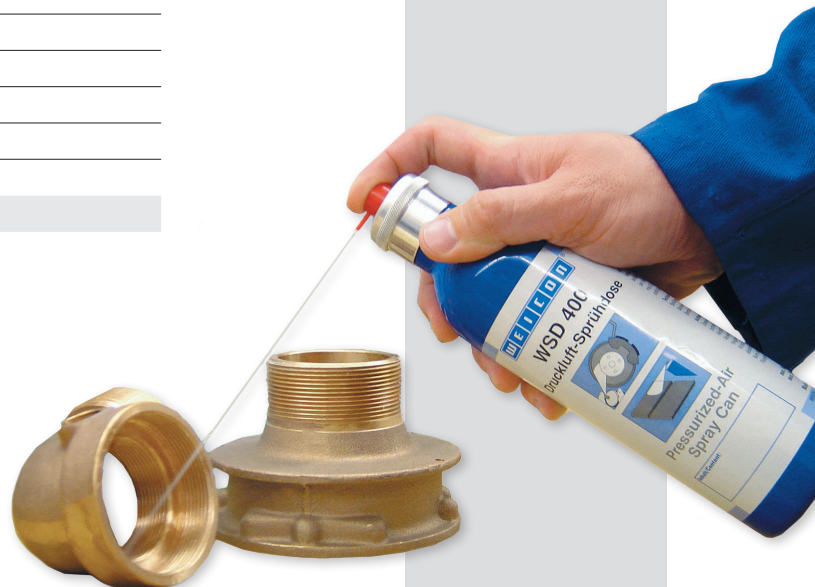
4er Sprühkopf-Set 15811002