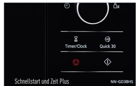
Schnellstart und Zeit Plus

Dampfgarer inkl. PanaCrunch-Pfanne – 2 in 1 Zubehör im Lieferumfang enthalten 8 Automatikprogramme zum Dampfgaren – Punktgenaue Zubereitung ganz automatisch Kombinationskochen – Mikrowelle mit Grill für schnelle, knusprige Köstlichkeiten Schnellstart mit Quick 30 – Einstellen der Garzeit auf Tastendruck in 30-Sekunden-Schritten Zeit Plus-Funktion – Ganz einfach jederzeit zusätzliche Garzeit hinzufügen Inverter-Technologie – Bis zu 30 % sanfter, schneller und energiesparender erwärmen Hochwertiges, modernes Design – Edelstahl Elemente und Touch-Bedienfeld