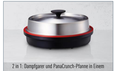
2 in 1: Dampfgarer und PanaCrunch-Pfanne in Einem