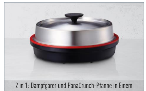
2 in 1: Dampfgarer und PanaCrunch-Pfanne in Einem