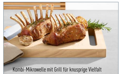
Kombi-Mikrowelle mit Grill für knusprige Vielfalt

Mit der neuen Grill-Kombi-Mikrowelle NN-GD35 ermöglicht Panasonic den preisbewussten Einstieg ins gesunde Dampfgaren. Das neue Zubehör, der Dampfgarer, macht aus dieser Inverter-Mikrowelle ganz einfach ein cleveres Dampfgargerät. Damit bietet es alle Möglichkeiten des nährstoffschonenden Garens mit Wasserdampf. Zusätzlich können jetzt auch schnell leckere Fisch- und Muschelgerichte, Risotto und vieles mehr gedünstet werden. Mit der praktischen PanaCrunch-Pfanne werden herrlich knusprige Pizzen, Flammkuchen oder Fleisch ganz einfach in der Mikrowelle zubereitet.