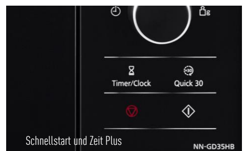
Schnellstart und Zeit Plus

Dampfgarer inkl. PanaCrunch-Pfanne – 2 in 1 Zubehör im Lieferumfang enthalten 8 Automatikprogramme zum Dampfgaren – Punktgenaue Zubereitung ganz automatisch Kombinationskochen – Mikrowelle mit Grill für schnelle, knusprige Köstlichkeiten Schnellstart mit Quick 30 – Einstellen der Garzeit auf Tastendruck in 30-Sekunden-Schritten Zeit Plus-Funktion – Ganz einfach jederzeit zusätzliche Garzeit hinzufügen Inverter-Technologie – Bis zu 30 % sanfter, schneller und energiesparender erwärmen Hochwertiges, modernes Design – Touch-Bedienfeld und Front in Klavierlackoptik