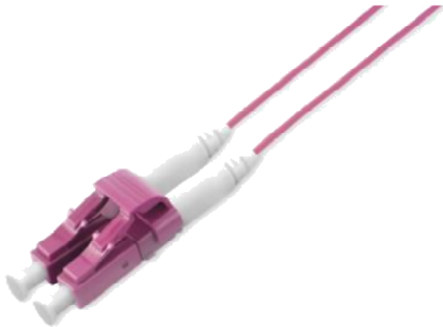
Abbildung: OM4 - 50/125 \mu