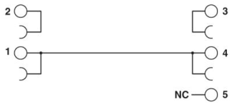
Csatlakozási ábra PLC-VT