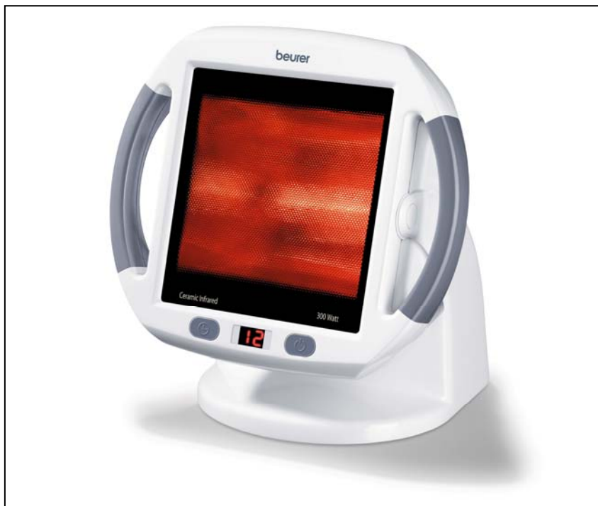
Ⓜ Infravörös hőszugárzó Használati utasítás.....2-11