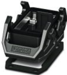
HEAVYCON EVO műanyag falra szerelhető tokozat, B10, keresztirányú reteszelfüllel, magasság 30,5 mm, lapos tömítéssel

Kérjük, vegye figyelembe, hogy az itt megadott adatok az online katalógusból származnak! Teljes körű tájékoztatást a felhasználói dokumentáció tartalmaz. Az internet-letöltés általános használati feltételei érvényesek. ( http://download.phoenixcontact.de )