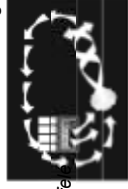
Ablakkal vagy klímával szállítás felfrissítésére alkalmas.

Nyár A ventilátort használja együtt a klímaberendezéssel, hogy kellemes, friss levegőmozgást érjen el. A generált szellőzés eltávolítja az álló levegőt és segít a testnek hőt kibocsátani, hogy felfrissüljön. Ha a légkeeringetőt a légkondicionálóval együtt vagy egy nyitott ablakkal együtt használja, akkor nem kell olyan hűvösre állítania a légkondicionálót, és ezzel megtakaríthatja az elektromos áram költségeket.