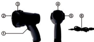
1. kép: Áttekintés