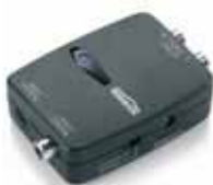
1x Audio Converter