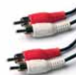
1x RCA to RCA audio Cable