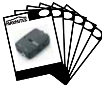
1x User manual English, Deutsch, Français, Español, Italiano, Nederlands