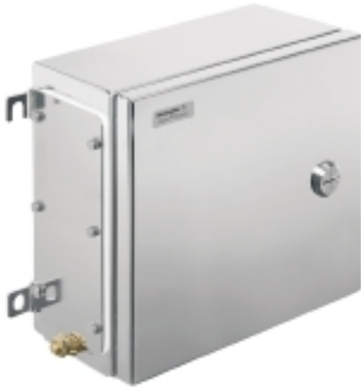
Illustrazione del prodotto

Weidmüller Interface GmbH & Co. KG Klingenbergstraße 16 D-32758 Detmold Germany Fon: +49 5231 14-0 Fax: +49 5231 14-292083 www.weidmueller.com