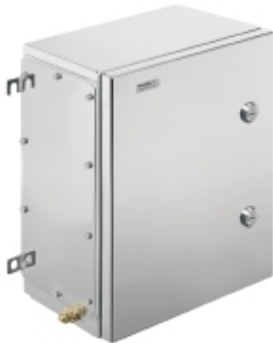
Illustrazione del prodotto

Weidmüller Interface GmbH & Co. KG Klingenbergstraße 16 D-32758 Detmold Germany Fon: +49 5231 14-0 Fax: +49 5231 14-292083 www.weidmueller.com