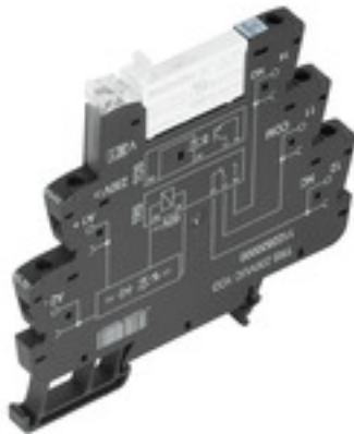
Illustrazione del prodotto

Weidmüller Interface GmbH & Co. KG Klingenbergstraße 16 D-32758 Detmold Germany Fon: +49 5231 14-0 Fax: +49 5231 14-292083 www.weidmueller.com