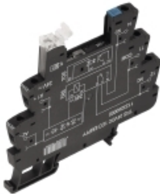
Illustrazione del prodotto

Weidmüller Interface GmbH & Co. KG Klingenbergstraße 16 D-32758 Detmold Germany Fon: +49 5231 14-0 Fax: +49 5231 14-292083 www.weidmueller.com