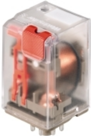
Illustrazione del prodotto

Weidmüller Interface GmbH & Co. KG Klingenbergstraße 16 D-32758 Detmold Germany Fon: +49 5231 14-0 Fax: +49 5231 14-292083 www.weidmueller.com