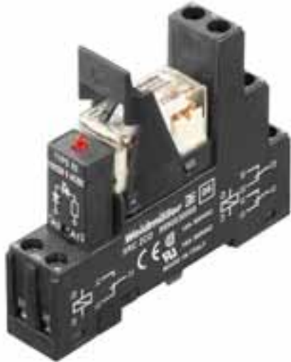
Illustrazione del prodotto

Weidmüller Interface GmbH & Co. KG Klingenbergstraße 16 D-32758 Detmold Germany Fon: +49 5231 14-0 Fax: +49 5231 14-292083 www.weidmueller.com