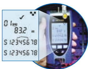
Mappa dei fili con lunghezza