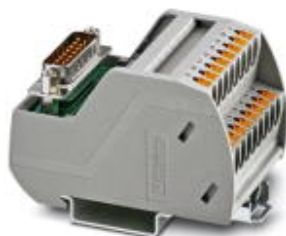
Modulo VARIOFACE con connessione Push-in e connettore femmina D-SUB miniaturizzato per l'installazione su guide di montaggio NS 35, n. poli: 9

Si ricorda che i dati qui indicati sono estrapolati dal catalogo online. Per informazioni e dati dettagliati, consultare la documentazione per l'utente. Si intendono applicate le Condizioni di utilizzo generali per i download da Internet. ( http://phoenixcontact.it/download )