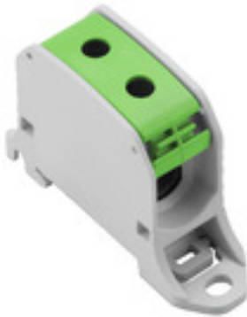
Illustrazione del prodotto

Weidmüller Interface GmbH & Co. KG Klingenbergstraße 16 D-32758 Detmold Germany Fon: +49 5231 14-0 Fax: +49 5231 14-292083 www.weidmueller.com