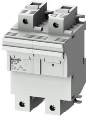
SENTRON, Zylindersicherungshalter, 22x58 mm, 1P+N, In: 100 A, Un AC: 690 V, LED Signalmelder