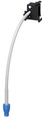
Drahtauslöser für RESET 0,4 m für 3RU2 Baugröße S00...S3