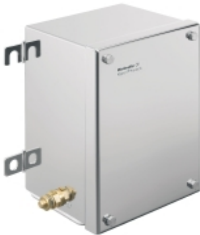
Illustrazione del prodotto

Weidmüller Interface GmbH & Co. KG Klingenbergstraße 16 D-32758 Detmold Germany Fon: +49 5231 14-0 Fax: +49 5231 14-292083 www.weidmueller.com