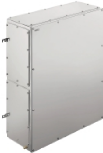
Illustrazione del prodotto

Weidmüller Interface GmbH & Co. KG Klingenbergstraße 16 D-32758 Detmold Germany Fon: +49 5231 14-0 Fax: +49 5231 14-292083 www.weidmueller.com