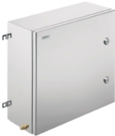
Illustrazione del prodotto

Weidmüller Interface GmbH & Co. KG Klingenbergstraße 16 D-32758 Detmold Germany Fon: +49 5231 14-0 Fax: +49 5231 14-292083 www.weidmueller.com