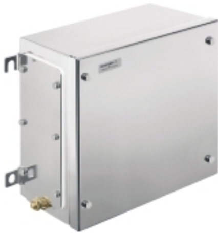
Illustrazione del prodotto

Weidmüller Interface GmbH & Co. KG Klingenbergstraße 16 D-32758 Detmold Germany Fon: +49 5231 14-0 Fax: +49 5231 14-292083 www.weidmueller.com