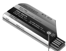
Premere il tasto per 5 secondi