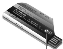
Richiesta di stato