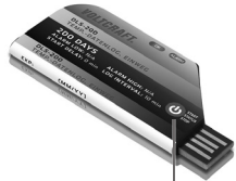
Premere il tasto per 5 secondi