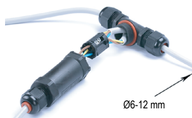
Cavi spellati, lunghezza del filo 6,5 cm (±0,5 cm).