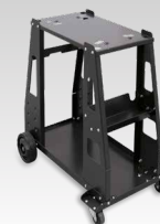
Carrello PLASMA 600 040298