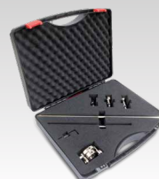
Kit compasso 040205