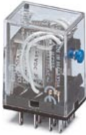
Industrirelais, Größe 1, Kontakt: 4 Wechsler, Eingangsspannung 24 V DC

Bitte beachten Sie, dass die hier angegebenen Daten dem Online-Katalog entnommen sind. Die vollständigen Informationen und Daten entnehmen Sie bitte der Anwenderdokumentation. Es gelten die Allgemeinen Nutzungsbedingungen für Internet-Downloads. ( http://download.phoenixcontact.de )