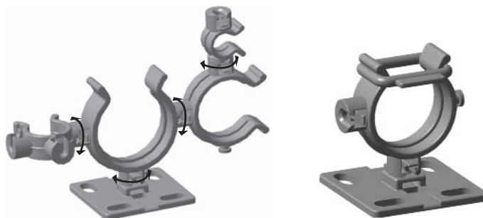
Iedere Helawrap Clip beschikt over meerdere koppelingen voor een hoge flexibiliteit bij het geleiden van bekabeling.