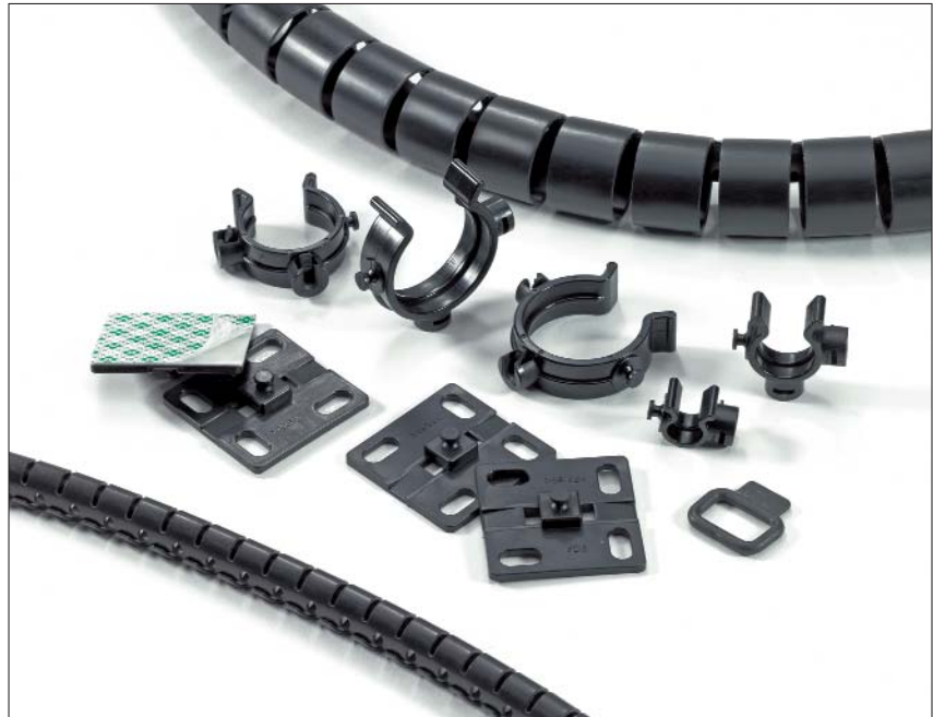
Helawrap-hulpstukken voor bundelen, bevestigen en beschermen van kabels.

Helawrap clips en bevestigingsvoetjes kunnen aan elkaar gekoppeld worden om talloze kabels te bundelen, te beschermen en te fixeren op machines. Ze kunnen tevens worden gebruikt in schakel- en besturingspanelen, met name in deursecties waar sprake is van veel bewegingen. Uiteraard kunnen de hulpstukken ook thuis of op kantoor worden gebruikt om de kabelchaos te helpen bestrijden.