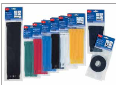
De TEXTIE®-serie is verkrijgbaar in diverse afmetingen en kleuren..

Op aanvraag zijn bevestigingshouders leverbaar. Neem contact met ons op!