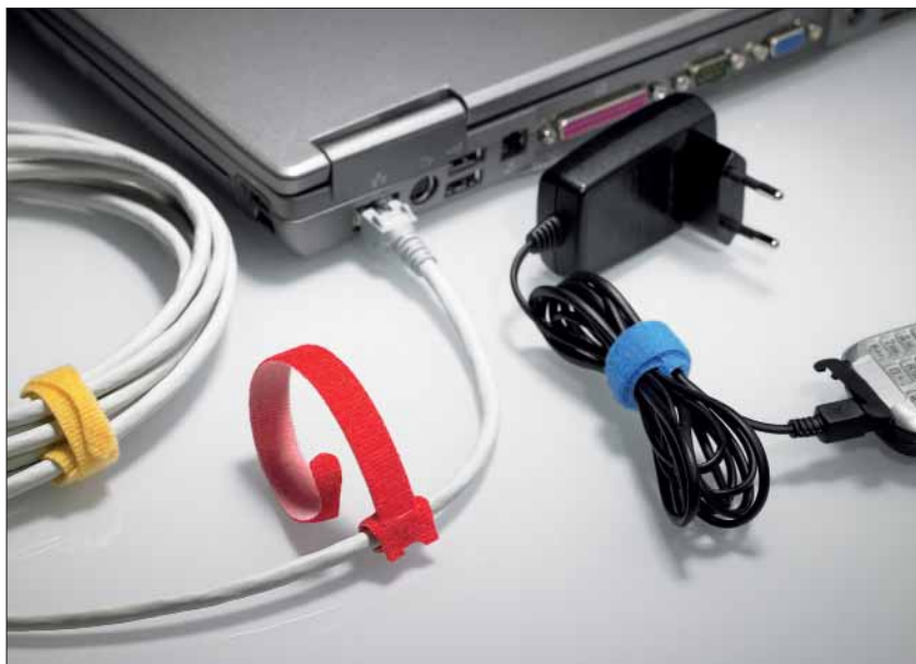
Dankzij de praktische bundelbandvorm kan de TEXTIE®-serie aan de kabel blijven zitten en raakt dus niet kwijt.

TEXTIE®-klittenbanden zijn vooral geschikt om kwetsbare kabels zoals lichtgeleiders, communicatiekabels en netwerkkabels te bundelen, zonder dat zij door het klittenband beschadigd, doorgesneden of geknikt worden. De hersluitbare TEXTIE®'s zijn ook een rationele oplossing in de podiumbouw, in sporttechniek en voor de voormontage van kabelbomen. Daarnaast zijn allerlei toepassingen op kantoor denkbaar, bijvoorbeeld de bundeling van PC- en hifikabels.