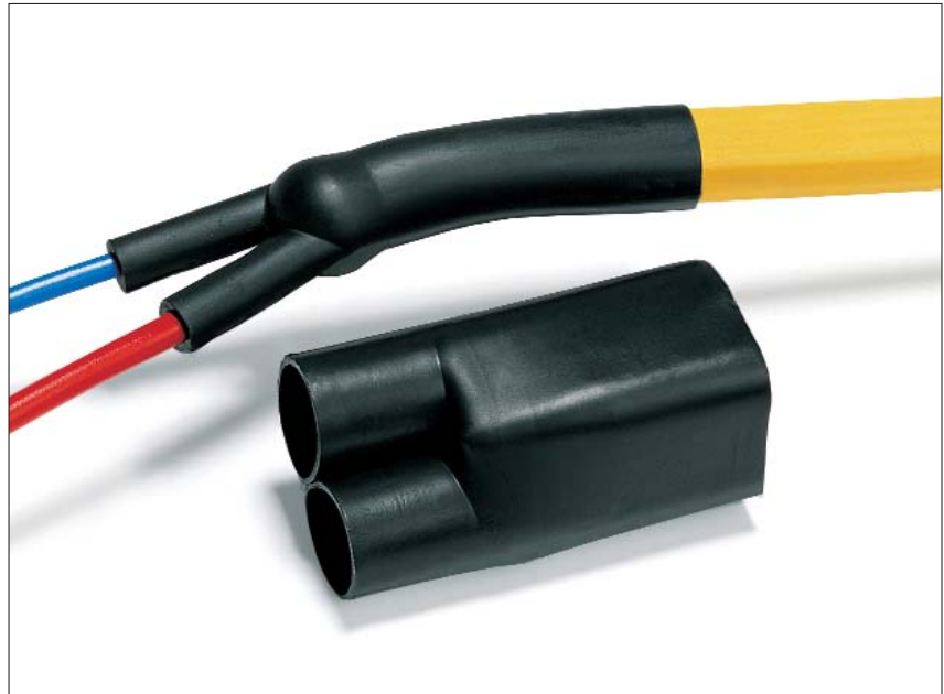
Eindafdichting HEV voor tweaderige kabel.

HEV-eindafdichtingen garanderen slijtvastheid en trekbelasting voor twee-, drie- en vieraderige kabels bij het leggen van alle gangbare kabeltypen conform VDE 0271 en 0272 (0,6 - 1,0 kV), zowel binnen als buiten. De inwendige lijmlaag dicht de leidingen af tegen vocht.