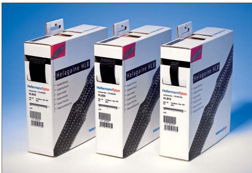
Helagaine HLB: de oprekverhouding maakt het mogelijk. Slechts drie types in een handige dispenserdoos voor bijna alle standaard diameters.

Het uitrafelen van de kous -tijdens het op lengte maken- kan worden voorkomen door de kous niet te knippen maar met behulp van een zogenaamde heatcutter af te smelten.