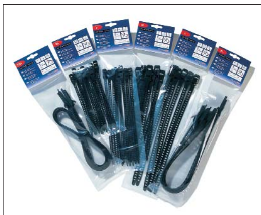
De SOFTFIX-familie is, in praktische verpakkingen, in kleine hoeveelheden leverbaar.