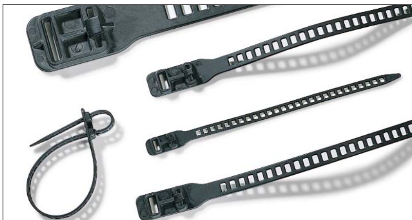
De SRT-bundelbanden zijn elastisch en veelzijdig inzetbaar.

Alle soorten bundels, met name voor databekabeling in binnen- en buitentoepassingen. Verder zijn deze heropenbare bundelbanden uitermate geschikt voor de land- en tuinbouw, boomkwekerijen en evenementen.