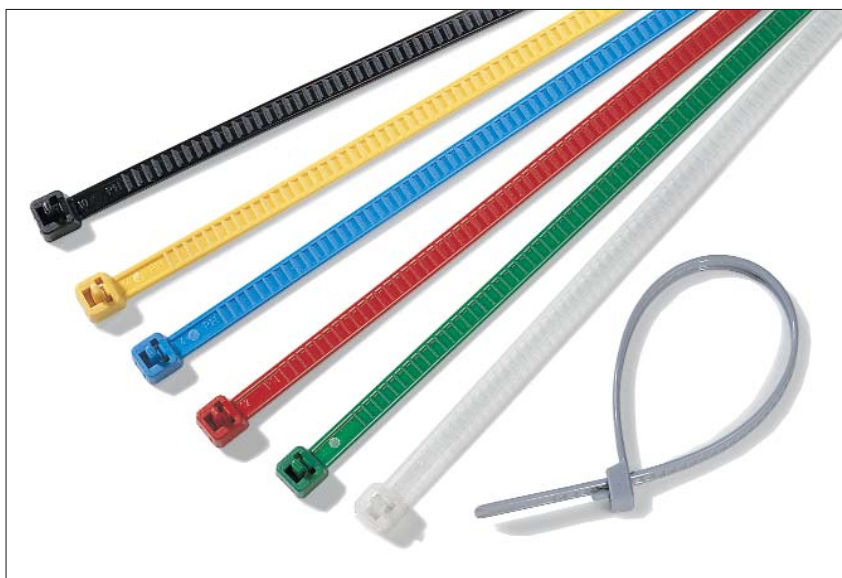
De bundelbanden uit de LR55-serie zijn geschikt als kleurmarkering en kunnen worden hergebruikt.

Deze bundelband is geschikt voor alle soorten bundels, o.a. ook als verpakkingsband, voor logistieke markeringen en in de voormontage.