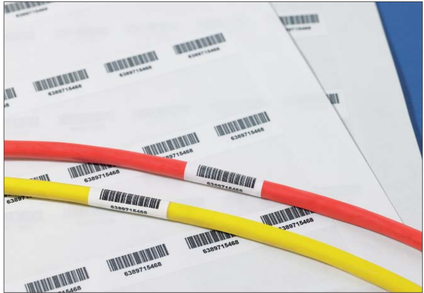
Helatag® zorgt voor duurzame markering van kabels met barcodes.