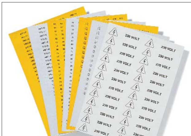
Exact passend met Helafix-dragers, voor een duurzame markering.

De HFX-labels zijn speciaal voor gebruik met Helafix-dragers ontwikkeld. Ze worden geleverd in A4-formaat en kunnen met laserprinters bedrukt of met de hand met markeringsstift T82 beschreven worden. Elk labelvel uit de serie HFX wordt tweekleurig geleverd (voorzijde geel, achterzijde wit).