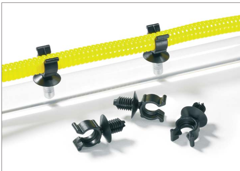
Geribbelde slang wordt veilig geleid na vastklikken in de houders.

Deze houders worden bijvoorbeeld in de auto-industrie, kabelconfectie en machinebouw gebruikt. Overal, waar geribbelde slang tijdsbesparend en veilig moeten worden bevestigd.