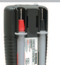
Houder voor de meetpunten