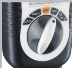
Eenvoudig te bedienen functiedraaiknop